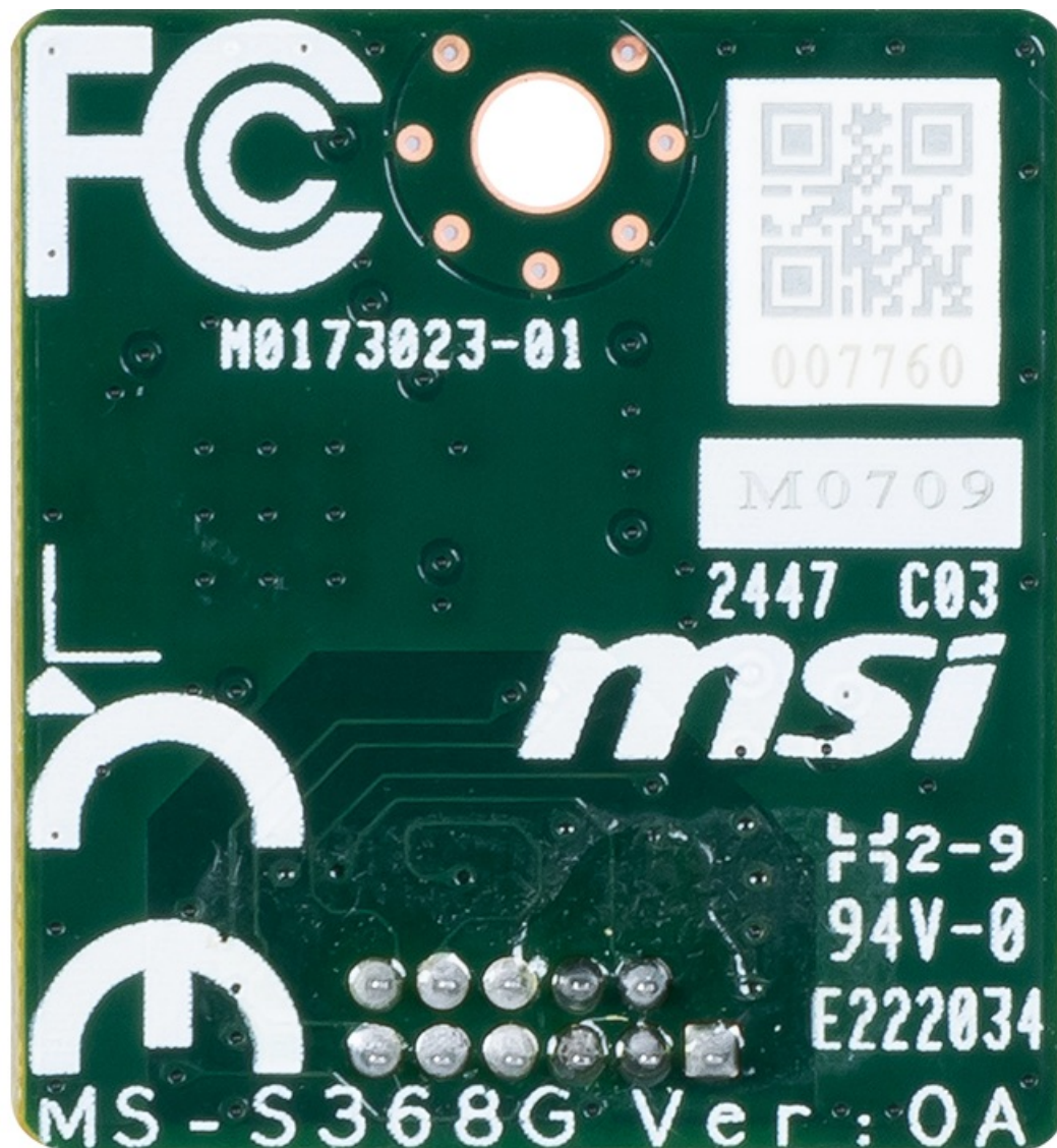
Фото MSI TPM20-IRS TPM-модуль TPM 2.0

Отправьте запрос на коммерческое предложение и получите индивидуальные цены и сроки поставки. Серверы, ноутбуки, моноблоки, материнские платы и видеокарты. Игровые ПК, мониторы и комплектующие. Каталог, актуальные цены, наличие и поставка