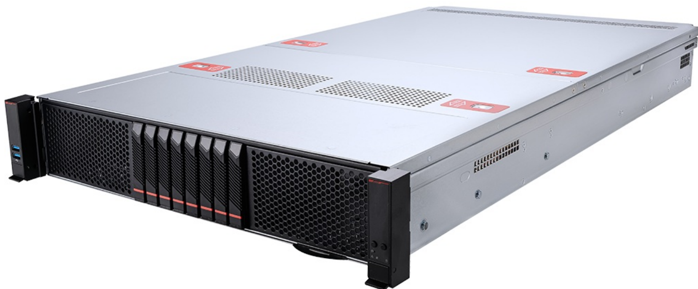
Фото MSI CX270-S5062 S5062X270RAU8 серверная barebone-платформа 2U Enterprise

Отправьте запрос на коммерческое предложение и получите индивидуальные цены и сроки поставки. Серверы, ноутбуки, моноблоки, материнские платы и видеокарты. Игровые ПК, мониторы и комплектующие. Каталог, актуальные цены, наличие и поставка