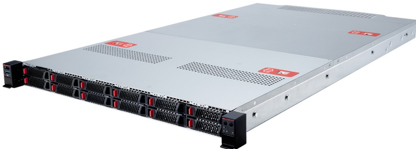
Фото MSI CX170-S5062 S5062X170RAU12 1U серверная barebone-платформа

Отправьте запрос на коммерческое предложение и получите индивидуальные цены и сроки поставки. Серверы, ноутбуки, моноблоки, материнские платы и видеокарты. Игровые ПК, мониторы и комплектующие. Каталог, актуальные цены, наличие и поставка