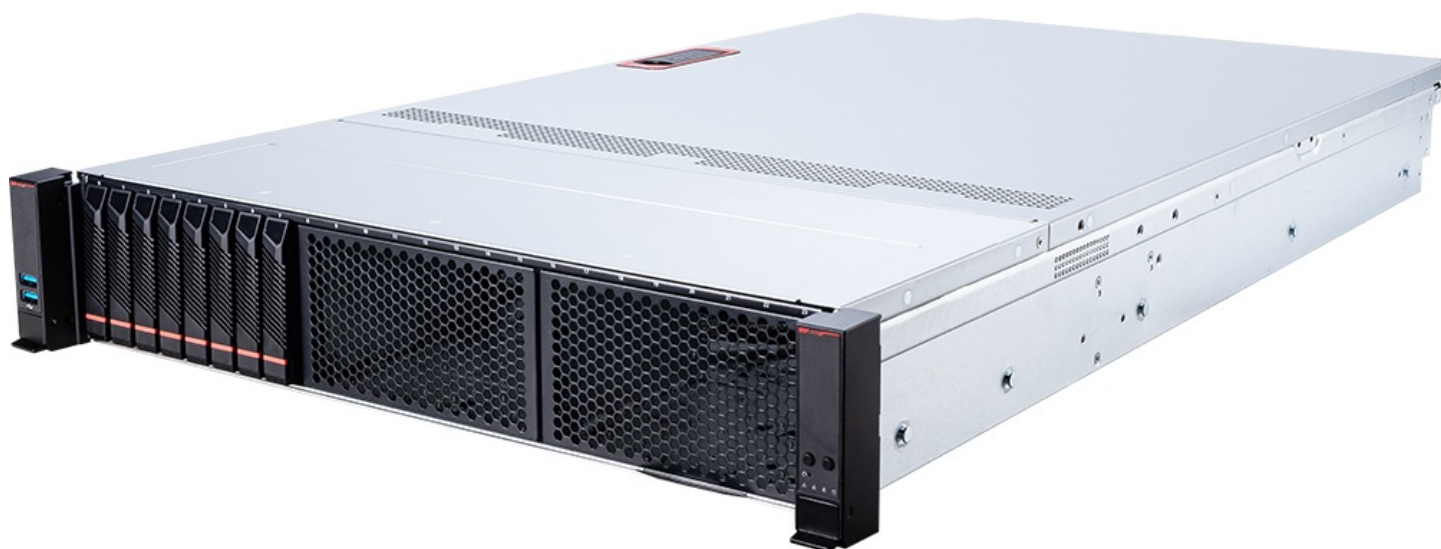
Фото MSI CX271-S4056 S4056X271RAU8 2U серверная barebone-платформа с AMD EPYC 9004/9005

Отправьте запрос на коммерческое предложение и получите индивидуальные цены и сроки поставки. Серверы, ноутбуки, моноблоки, материнские платы и видеокарты. Игровые ПК, мониторы и комплектующие. Каталог, актуальные цены, наличие и поставка