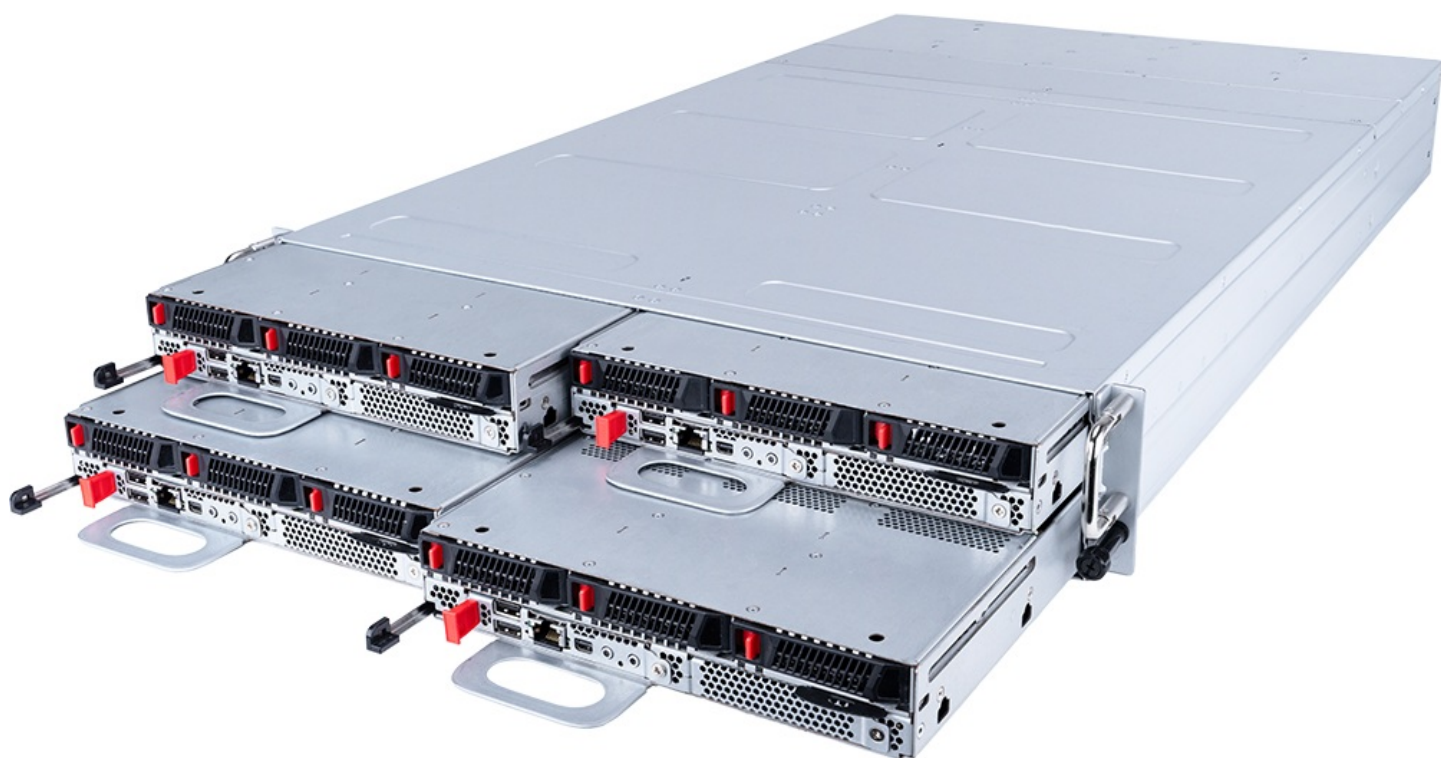
Фото MSI S4051D270RAU3-X4 серверная barebone-платформа 2U4N

Отправьте запрос на коммерческое предложение и получите индивидуальные цены и сроки поставки. Серверы, ноутбуки, моноблоки, материнские платы и видеокарты. Игровые ПК, мониторы и комплектующие. Каталог, актуальные цены, наличие и поставка