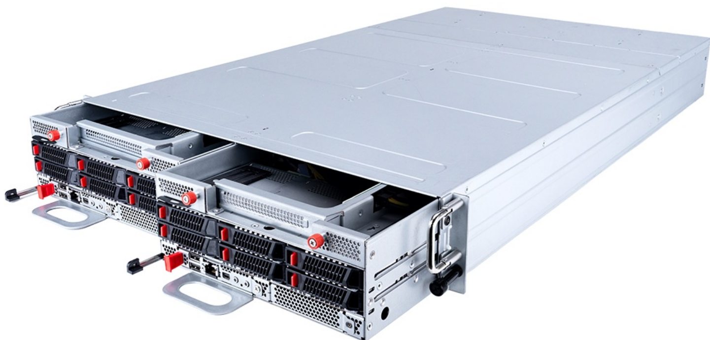
Фото MSI S3061D270RAU6-X2 сервер barebone 2U2N

Отправьте запрос на коммерческое предложение и получите индивидуальные цены и сроки поставки. Серверы, ноутбуки, моноблоки, материнские платы и видеокарты. Игровые ПК, мониторы и комплектующие. Каталог, актуальные цены, наличие и поставка