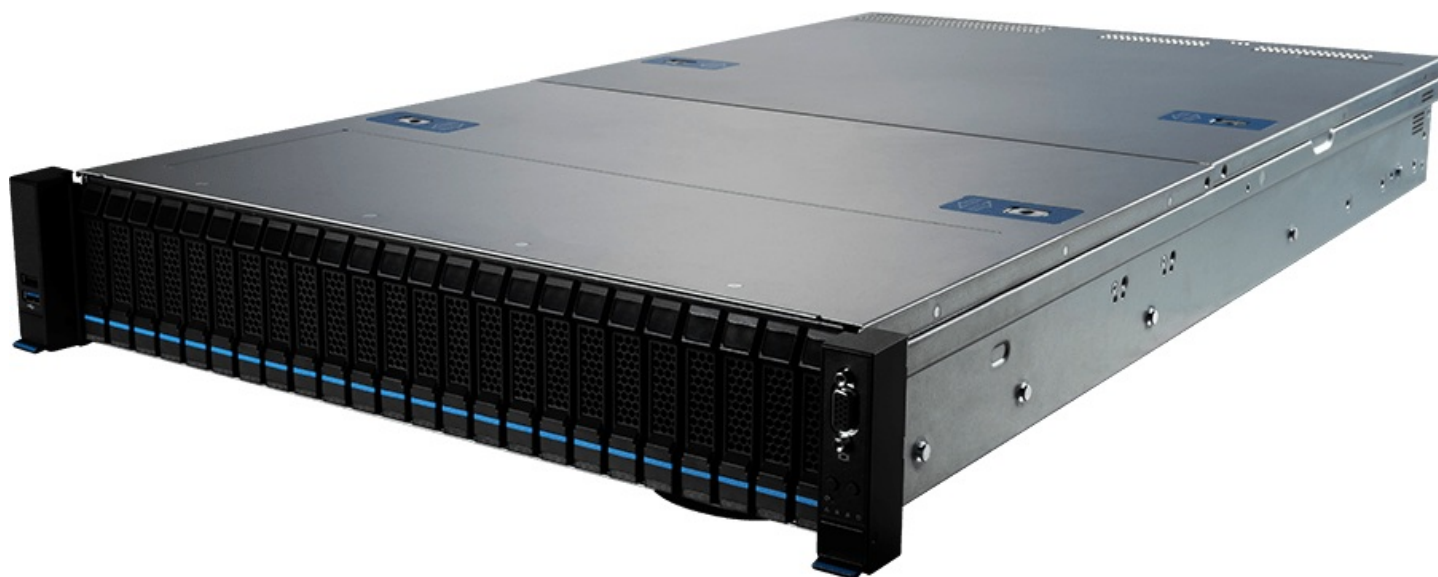
Фото MSI S2206-06-10G серверная barebone-платформа 2U

Отправьте запрос на коммерческое предложение и получите индивидуальные цены и сроки поставки. Серверы, ноутбуки, моноблоки, материнские платы и видеокарты. Игровые ПК, мониторы и комплектующие. Каталог, актуальные цены, наличие и поставка