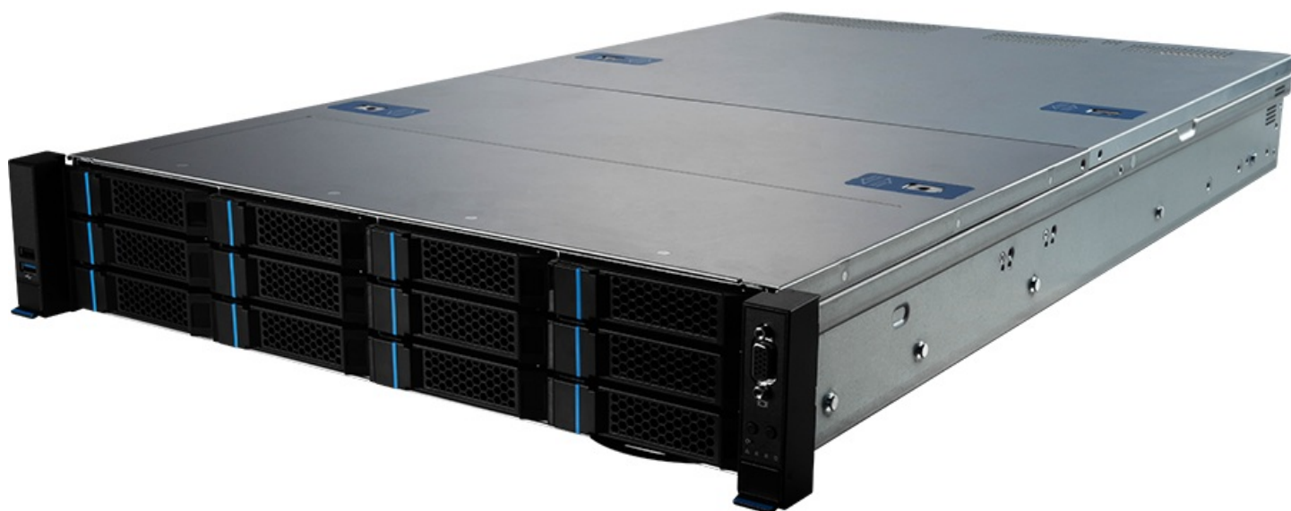
Фото MSI S2206-05-10G серверная barebone-платформа 2U

Отправьте запрос на коммерческое предложение и получите индивидуальные цены и сроки поставки. Серверы, ноутбуки, моноблоки, материнские платы и видеокарты. Игровые ПК, мониторы и комплектующие. Каталог, актуальные цены, наличие и поставка