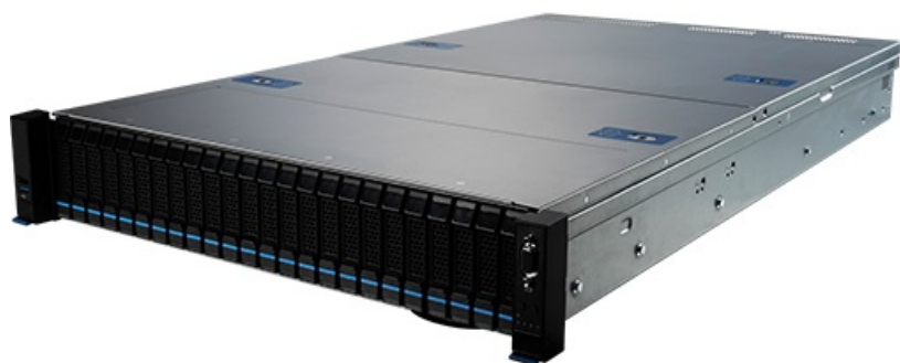
Фото MSI S2206-04 серверная barebone-платформа 2U

Отправьте запрос на коммерческое предложение и получите индивидуальные цены и сроки поставки. Серверы, ноутбуки, моноблоки, материнские платы и видеокарты. Игровые ПК, мониторы и комплектующие. Каталог, актуальные цены, наличие и поставка