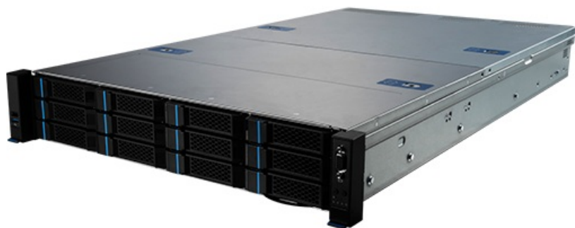
Фото MSI S2206-02 серверная barebone-платформа 2U

Отправьте запрос на коммерческое предложение и получите индивидуальные цены и сроки поставки. Серверы, ноутбуки, моноблоки, материнские платы и видеокарты. Игровые ПК, мониторы и комплектующие. Каталог, актуальные цены, наличие и поставка