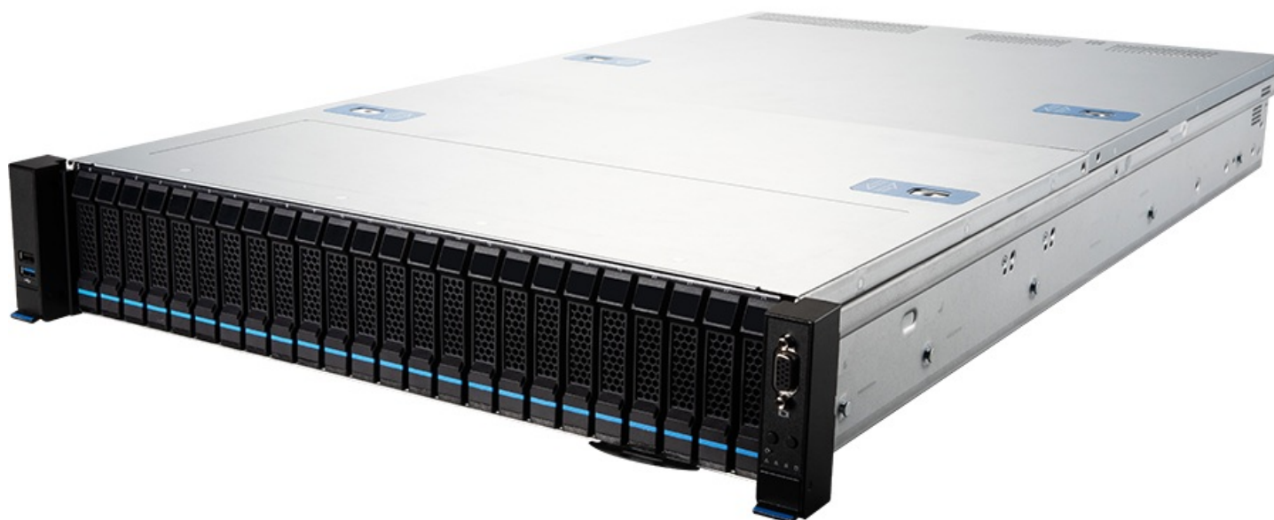
Фото MSI S2205-04-10G серверная barebone-платформа 2U

Отправьте запрос на коммерческое предложение и получите индивидуальные цены и сроки поставки. Серверы, ноутбуки, моноблоки, материнские платы и видеокарты. Игровые ПК, мониторы и комплектующие. Каталог, актуальные цены, наличие и поставка