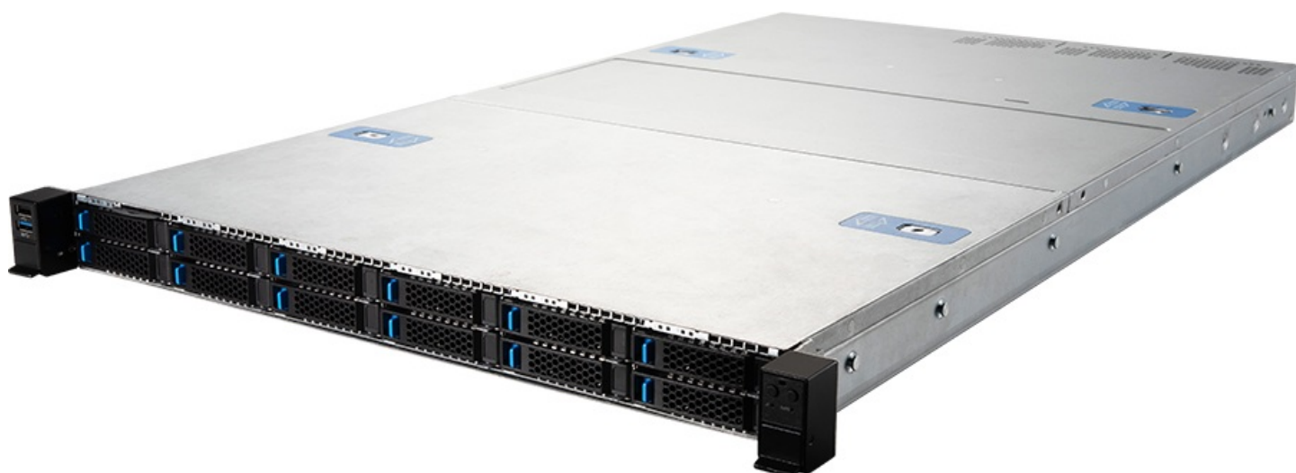
Фото MSI S2205-01 серверная barebone-платформа 2U

Отправьте запрос на коммерческое предложение и получите индивидуальные цены и сроки поставки. Серверы, ноутбуки, моноблоки, материнские платы и видеокарты. Игровые ПК, мониторы и комплектующие. Каталог, актуальные цены, наличие и поставка