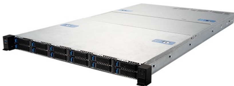
Фото MSI S1205-01 1U серверная barebone-платформа

Отправьте запрос на коммерческое предложение и получите индивидуальные цены и сроки поставки. Серверы, ноутбуки, моноблоки, материнские платы и видеокарты. Игровые ПК, мониторы и комплектующие. Каталог, актуальные цены, наличие и поставка