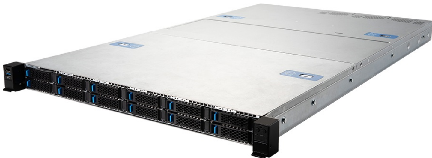
Фото MSI S1205-01-10G 1U серверная barebone-платформа

Отправьте запрос на коммерческое предложение и получите индивидуальные цены и сроки поставки. Серверы, ноутбуки, моноблоки, материнские платы и видеокарты. Игровые ПК, мониторы и комплектующие. Каталог, актуальные цены, наличие и поставка