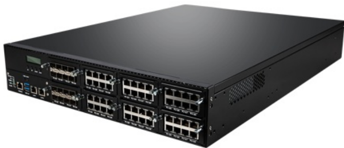
Фото MSI N5010 серверное сетевое устройство 2U

Тел: +7 499 288-20-15 | Email: sale@msi-russia.ru | https://msi-russia.ru