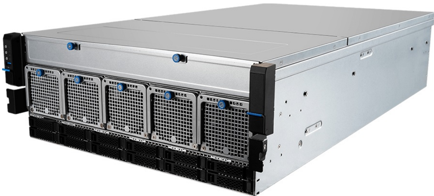
Фото MSI G4101-05 4U серверная barebone-платформа, AMD EPYC 9005/9004

Отправьте запрос на коммерческое предложение и получите индивидуальные цены и сроки поставки. Серверы, ноутбуки, моноблоки, материнские платы и видеокарты. Игровые ПК, мониторы и комплектующие. Каталог, актуальные цены, наличие и поставка