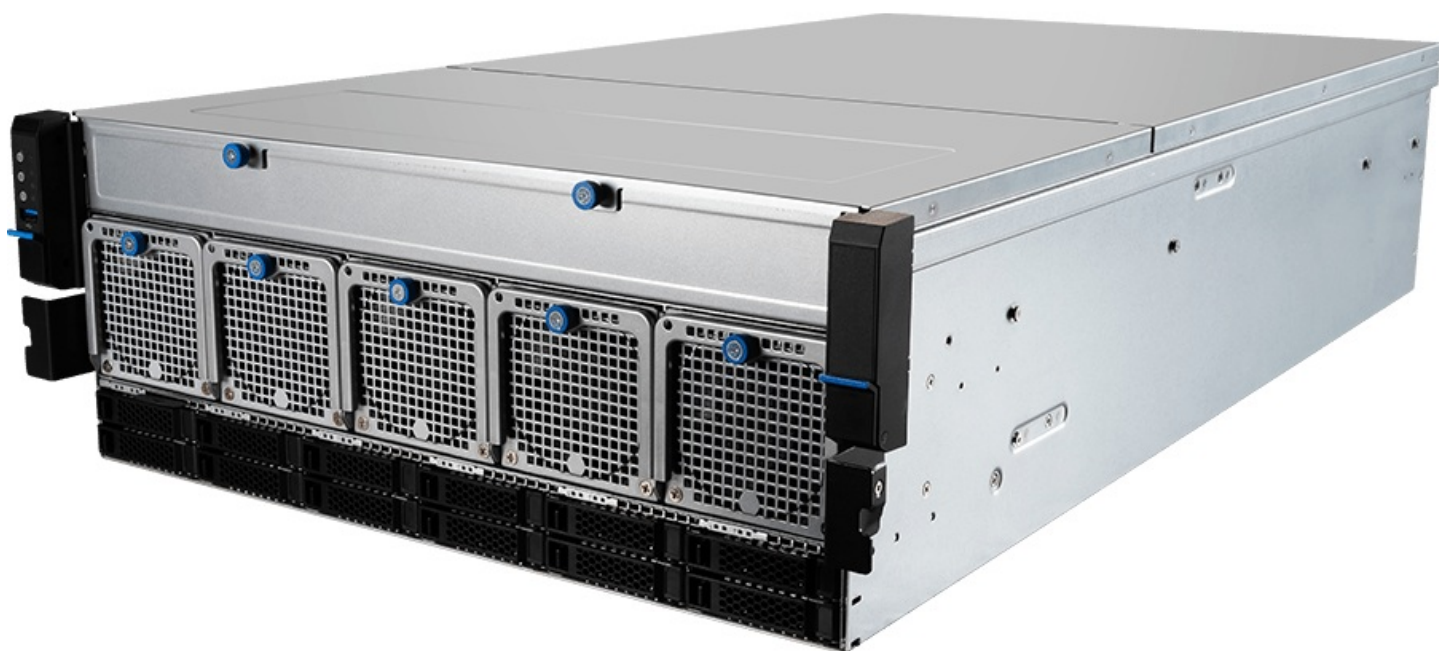
Фото MSI G4101-01 - сервер barebone 4U, AMD EPYC SP5, DDR5, U.2 NVMe, PCIe 5.0, 3000 Вт

Отправьте запрос на коммерческое предложение и получите индивидуальные цены и сроки поставки. Серверы, ноутбуки, моноблоки, материнские платы и видеокарты. Игровые ПК, мониторы и комплектующие. Каталог, актуальные цены, наличие и поставка